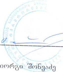
გიორგი შონვაძე თავმჯდომარე

ს.ს.ი.პ. „დაცული ტერიტორიების სააგენტო“ ქ. თბილისი, გულუას ქ.№6 ტელ: 995 32 2752352 ს/კ: 204911337 სახელმწიფო ხაზინა სახაზინო კოდი: 220101222 ა/ა № 200122900